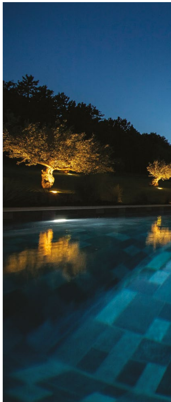
La lame d'eau est équipée d'un éclairage Led avec variation de couleurs.

Le chantier livré en juin 2021 a permis aux propriétaires de profiter des nouveaux aménagements dès l'été. Ce projet a été récompensé par la Fédération des Professionnels de la Piscine lors de la 16 e édition des Trophées de la Piscine et du Spa 2021 gratifiant chaque année les meilleures créations du secteur. Cette réalisation sublimée à la nuit tombée a reçu le Trophée d'Argent dans la catégorie Piscine de nuit. ■